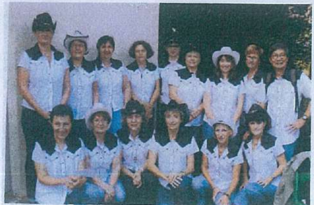
Nos CAUP'S COUNTRY