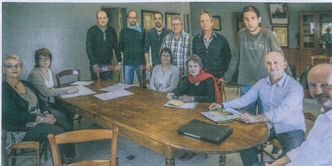
la nouvelle équipe municipale le jour de la passation des pouvoirs.